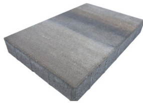
60 x 40 x 8 cm