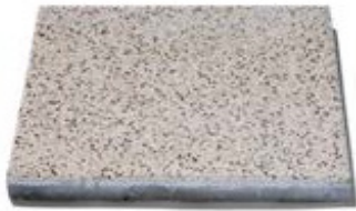
40 x 40