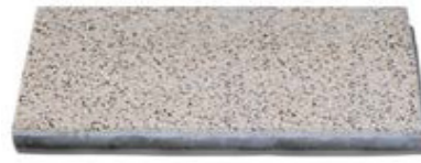
60 x 30